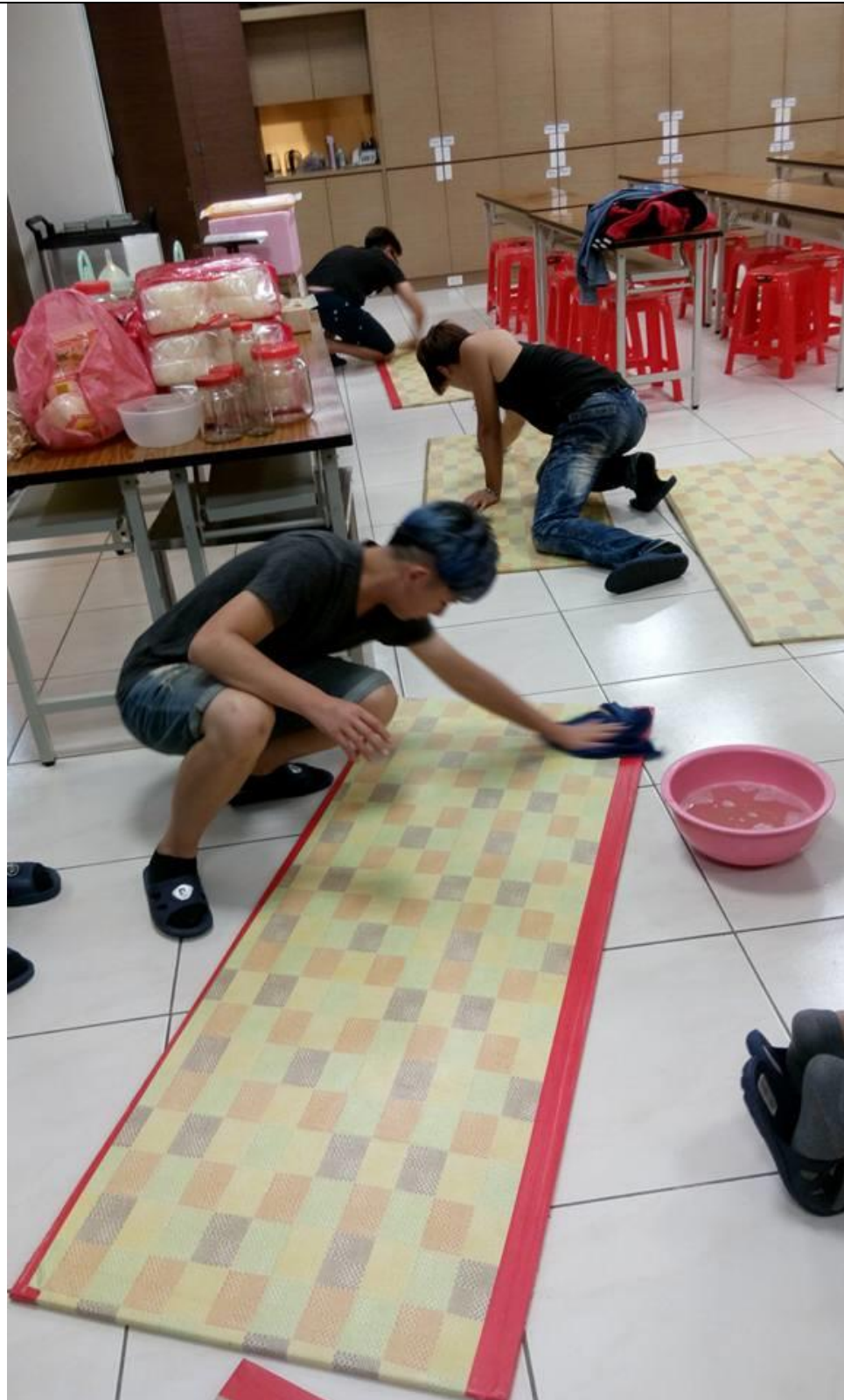
活動內容 照片 (四)